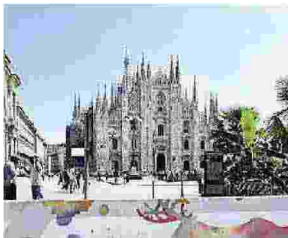
Milano, barriere al Duomo

riere, sulla Darsena e i Navigli e a corso Como, vicino alla torre Unicredit. L'amministrazione comunale ha poi lanciato un appello ai writer milanesi per colorare le barriere di cemento per renderli meno antiestetici, anche se l'idea resta quella di sostituire i new jersey con dei dissuasori di altro tipo: ad esempio i piloni uniti da catene d'acciaio collocati sul lungomare di Nizza dopo l'attentato del luglio 2016, che sono in grado di frenare la corsa dei tir. E c'è anche chi, come l'architetto Stefano Boeri, propone